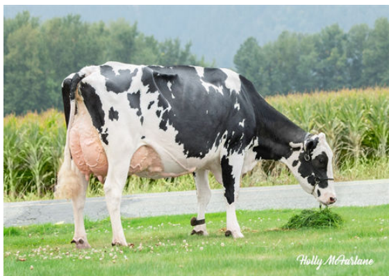
WESTCOAST ALCOVE RIZA 7512 DAM